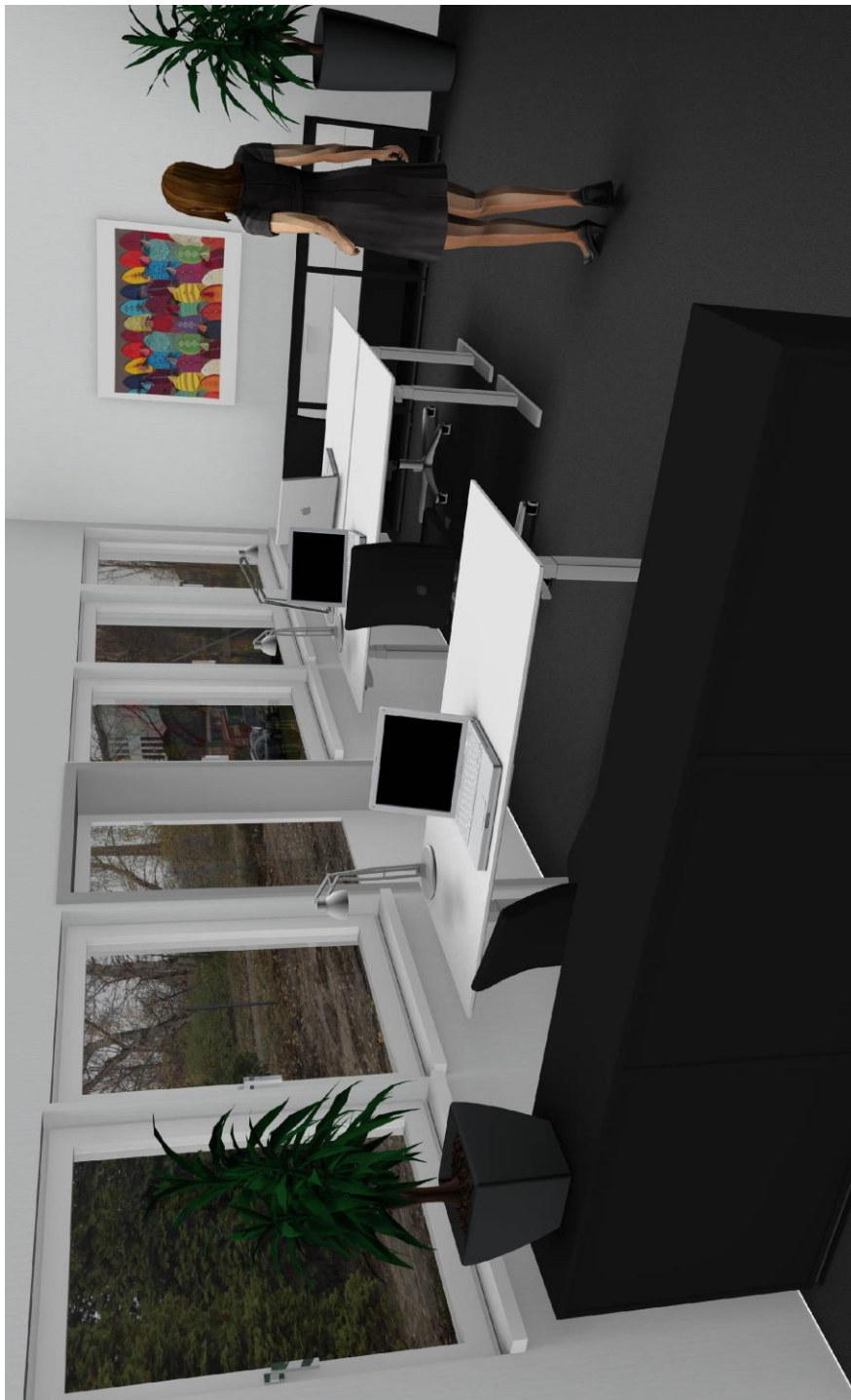
Stort kontor (60 m 2 )