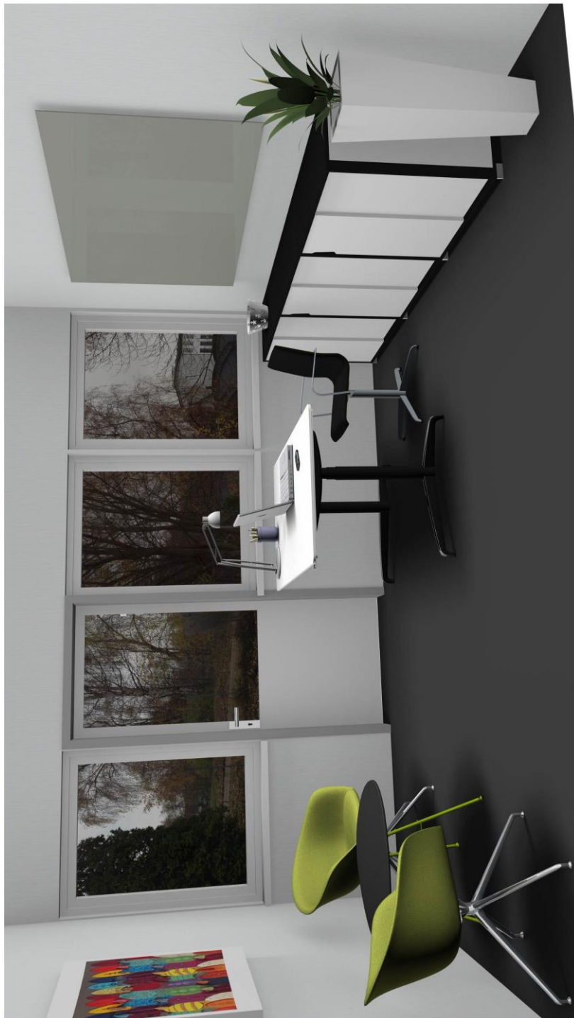
Lille kontor (30 m 2 )